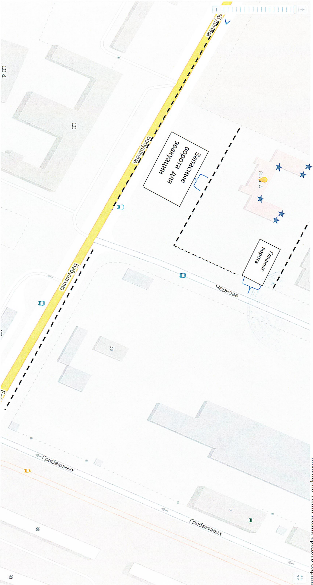
Приложение № 2 к Паспорту безопасности «План (схема) охраны объекта (территории) с указанием контрольно-пропускных пунктов, постов охраны, инженерно-технических средств охраны»